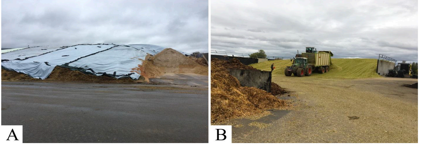
Şekil 2. Biyogaz Tesisi Üzeri Kapalı Biyokütle Yığını (A) veya Traktör Tarafından Beton Bunker Silosunda Preslenmiş Biyokütle (B)